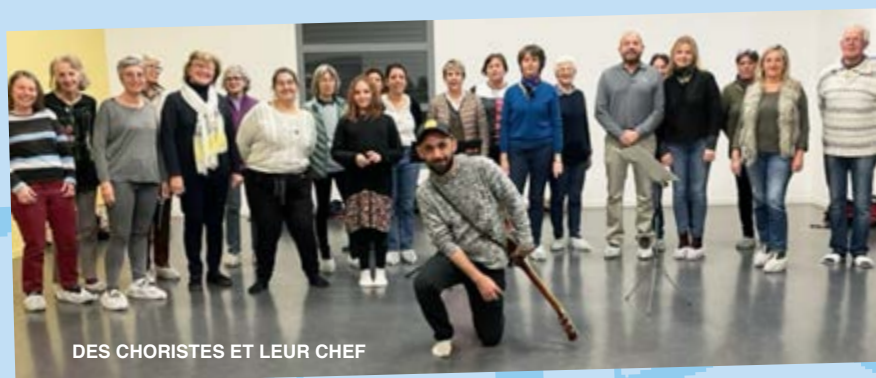
DES CHORISTES ET LEUR CHEF