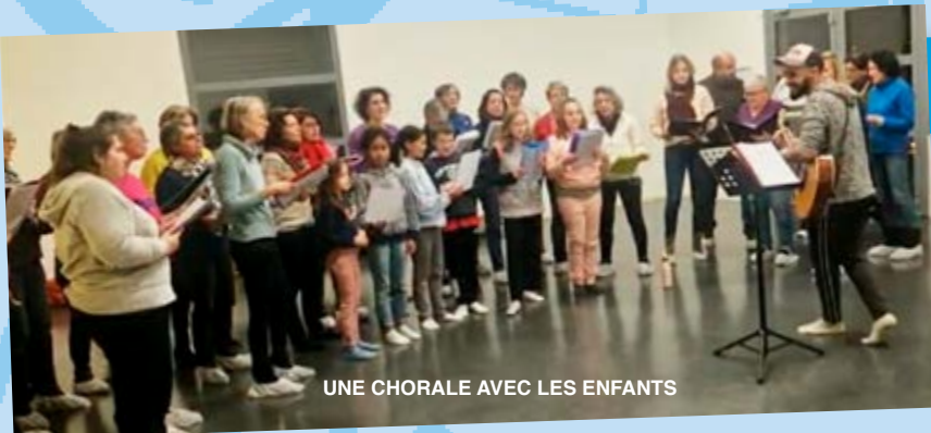
UNE CHORALE AVEC LES ENFANTS

Le premier soir, je me suis donc endormi sur le sable à mille milles de toute terre habitée. J'étais bien plus isolé qu'un naufragé sur un radeau au milieu de l'Océan. Alors vous imaginez ma surprise, au lever du jour, quand une drôle de petite voix, d'une certaine Lou, m'a réveillé. Elle disait :