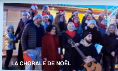
LA CHORALE DE NOËL

Amusez-vous à retrouver tous les titres que vous entendrez ce soir-là le 11 avril à 19h30