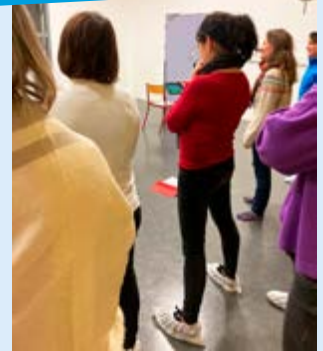
DES CHORISTES ATTENTIVES

On a pu apprécier le joli talent débutant du groupe, en décembre 2021, en plein air, au centre commercial ; aujourd'hui, Auz'chanter offre un concert aux Auziellois le 11 avril prochain à 19h30 à l'église d'Auzielle . Réservez votre soirée ! Save the date !